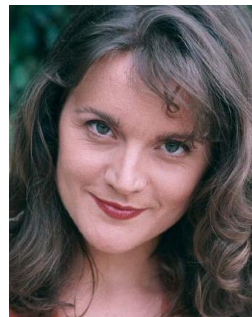
INÉS MORALEDA mezzo-soprano/recitadora