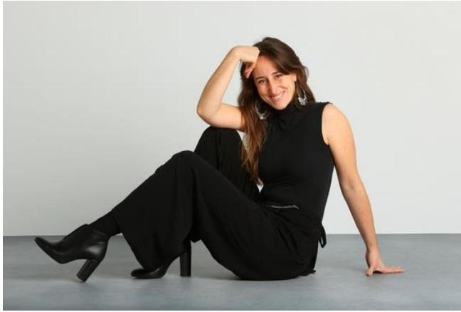
GISELA VILLAMAYOR soprano