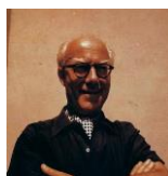
Robert GERHARD (Valls, 1896 - Anglaterra, 1970) Quintet de vent (compost l'any 1928)