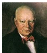
Paul HINDEMITH (Alemanya, 1895 - 1963)