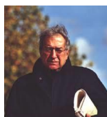
Luciano BERIO (Italia, 1925 - 2003)